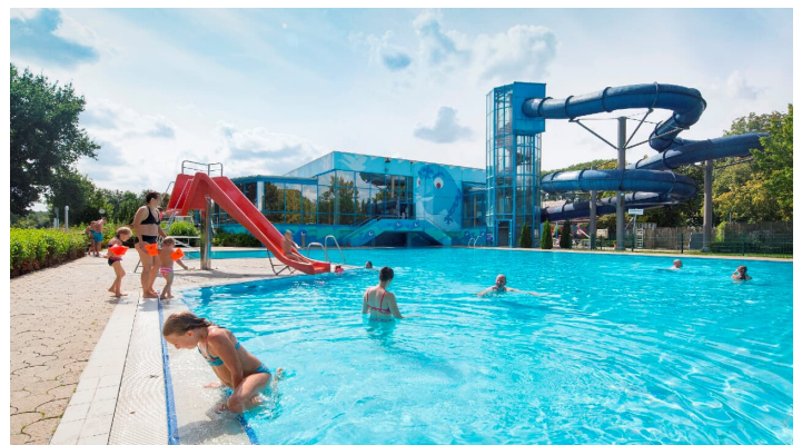
See- und Hallenbad Senden