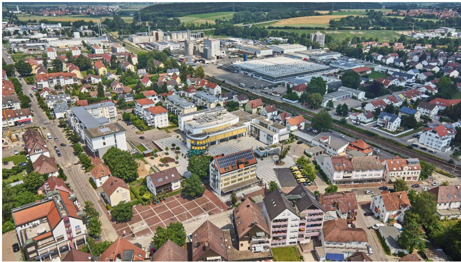
Senden an der Iller