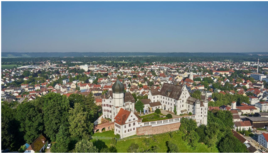
Illertissen Luftbild