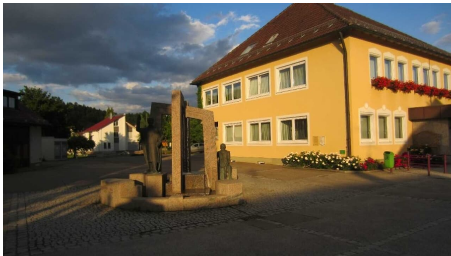
Rathaus Brunnen Bellenberg