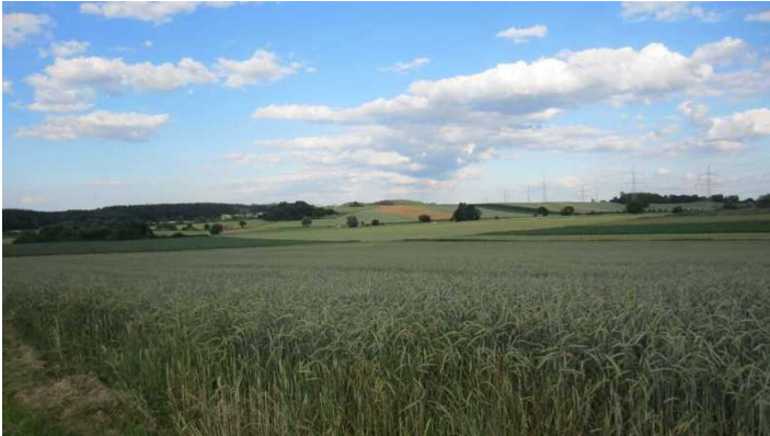
Blick auf die Felder nach dem Reiterhof Schwetzky Bellenberg