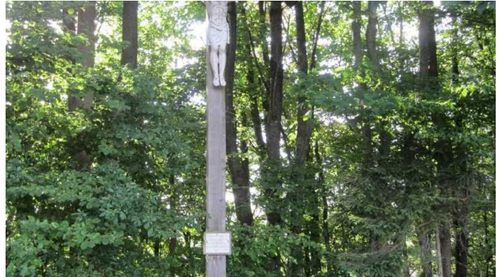
Kreuz Krähenberg Bellenberg