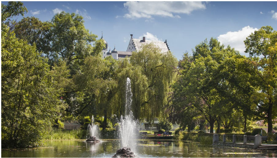
Illertissen Stadtpark