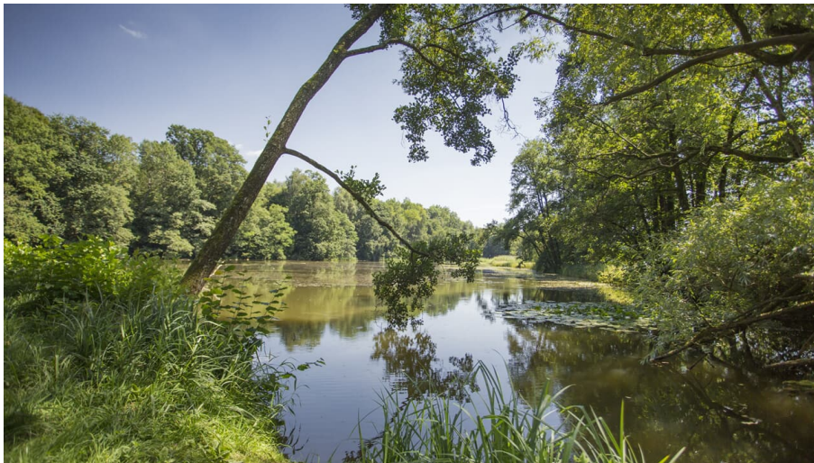
Roggenburg Biberspuren