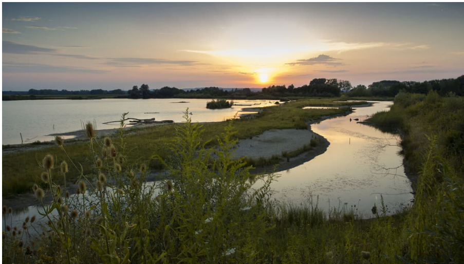
Plessenteich im Abendlicht