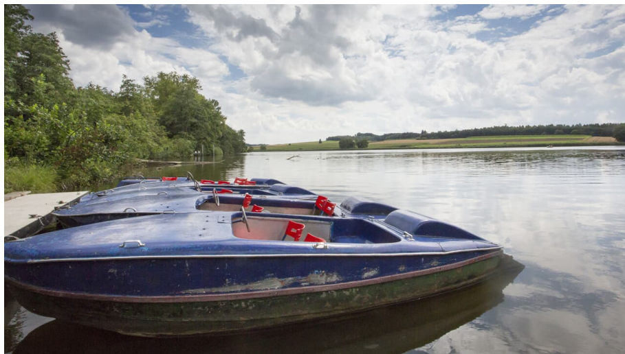
Klosterweiher mit Booten