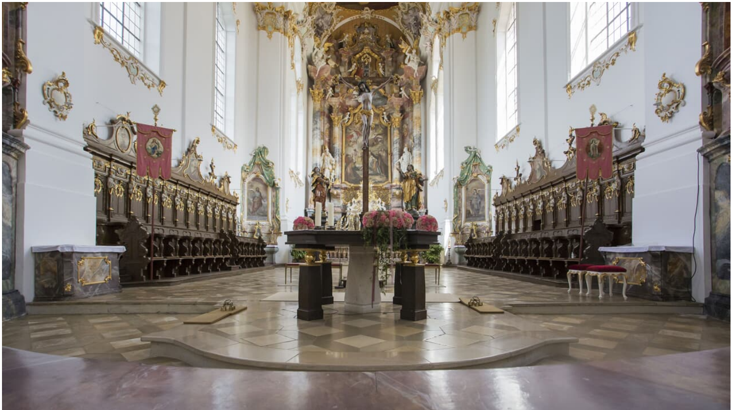
Klosterkirche Roggenburg