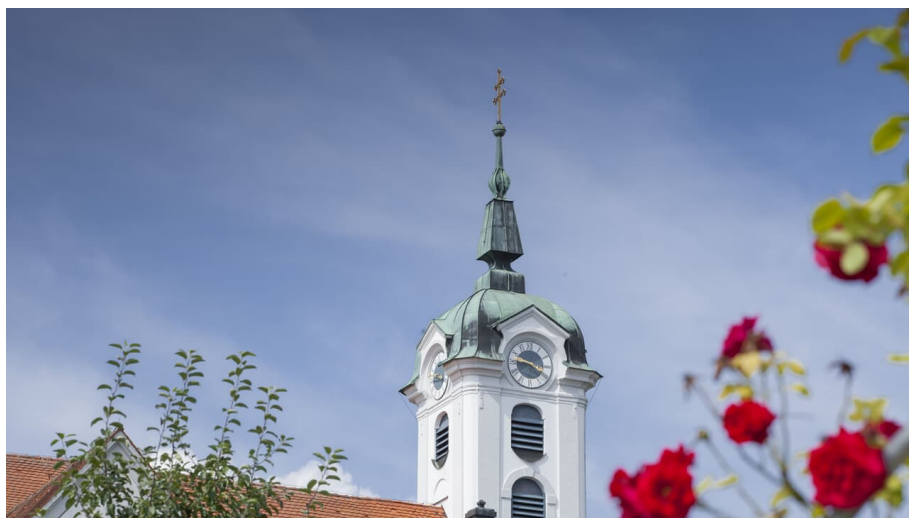
Kirchturm Oberelchingen