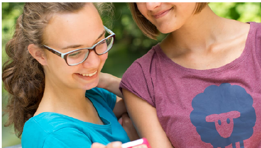
Quiztour Brenzufer-Pfad