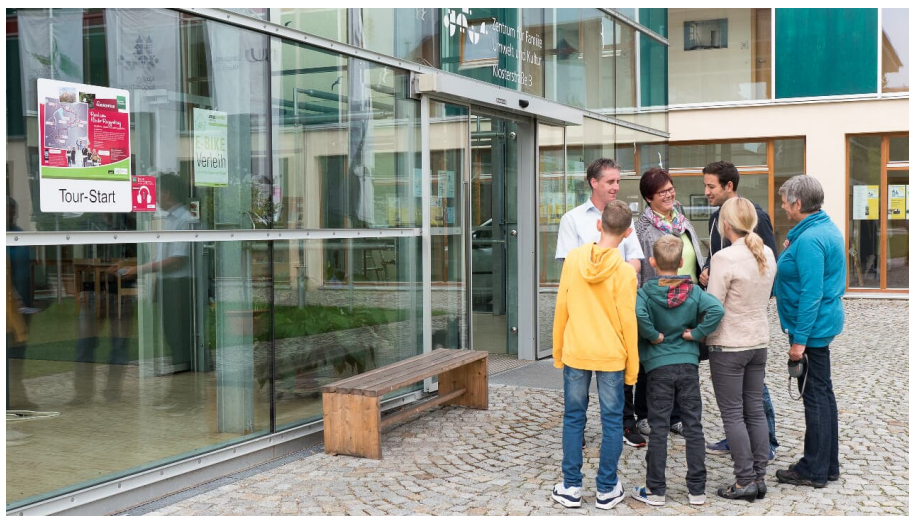
Lauschtour "Rund ums Kloster Roggenburg"