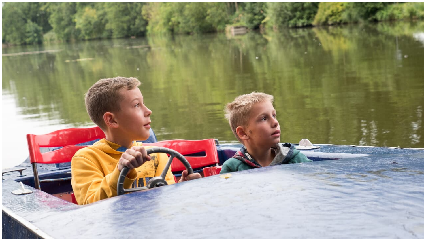
Lauschtour "Rund ums Kloster Roggenburg" - © Landkreis Neu-Ulm