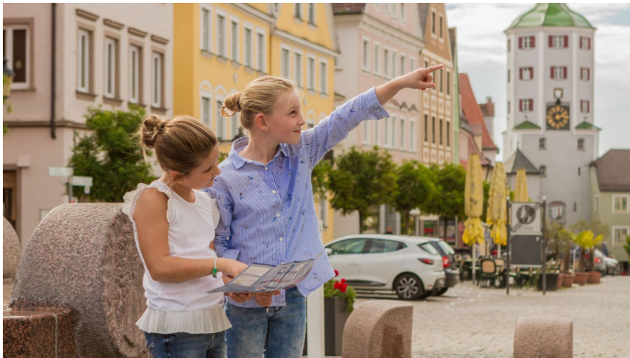
Stadtrallye - "Junge Entdecker unterwegs"