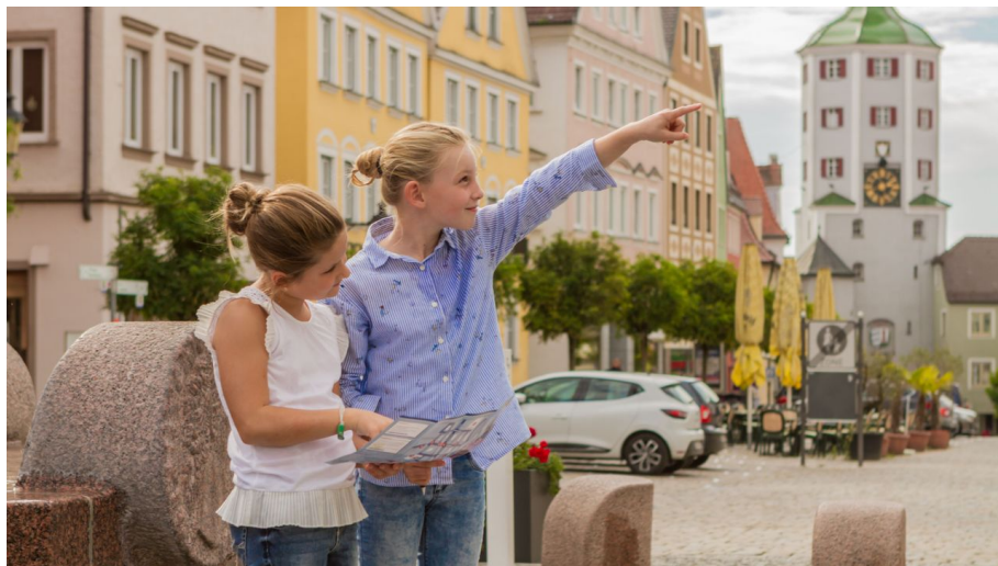
Stadtrallye - "Junge Entdecker unterwegs"