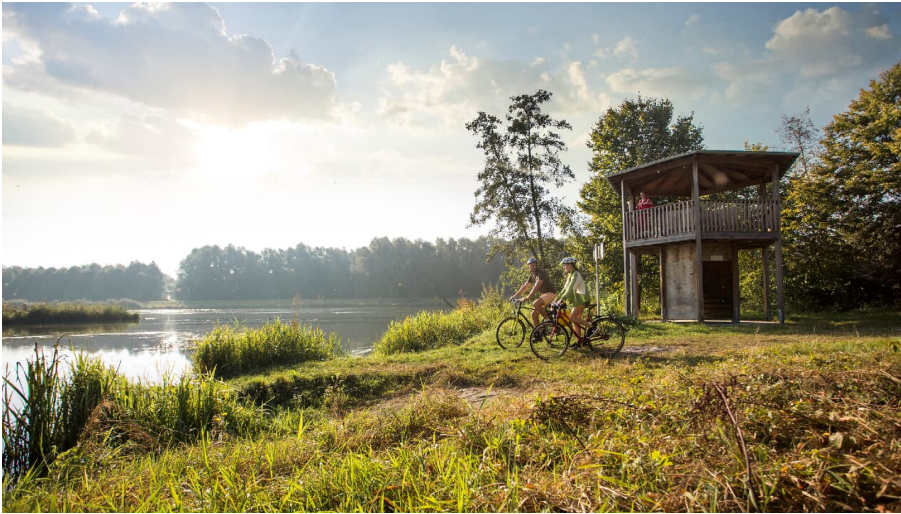
Grüner Thronsaal - © Fouad Vollmer