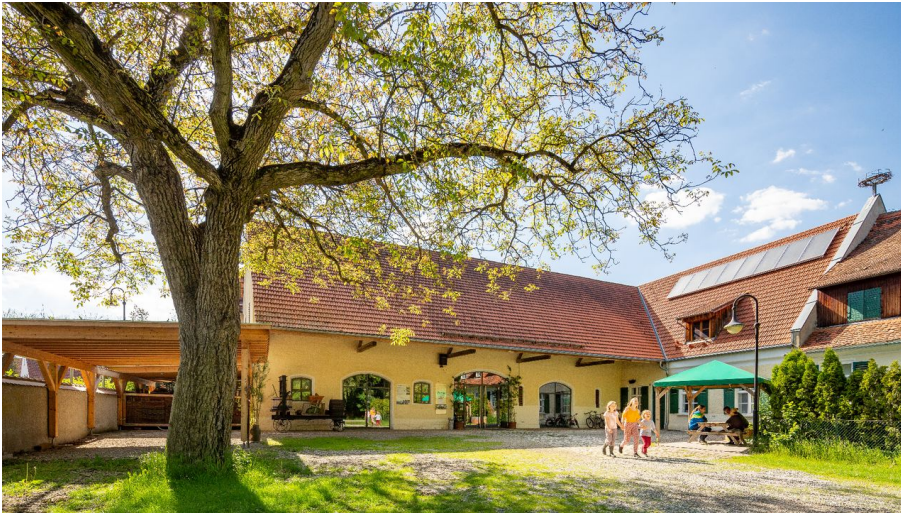
Umweltstation mooseum Bächingen