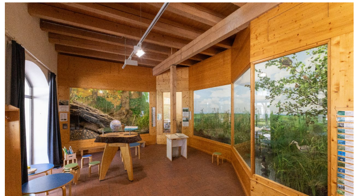
Umweltstation mooseum Dauerausstellung