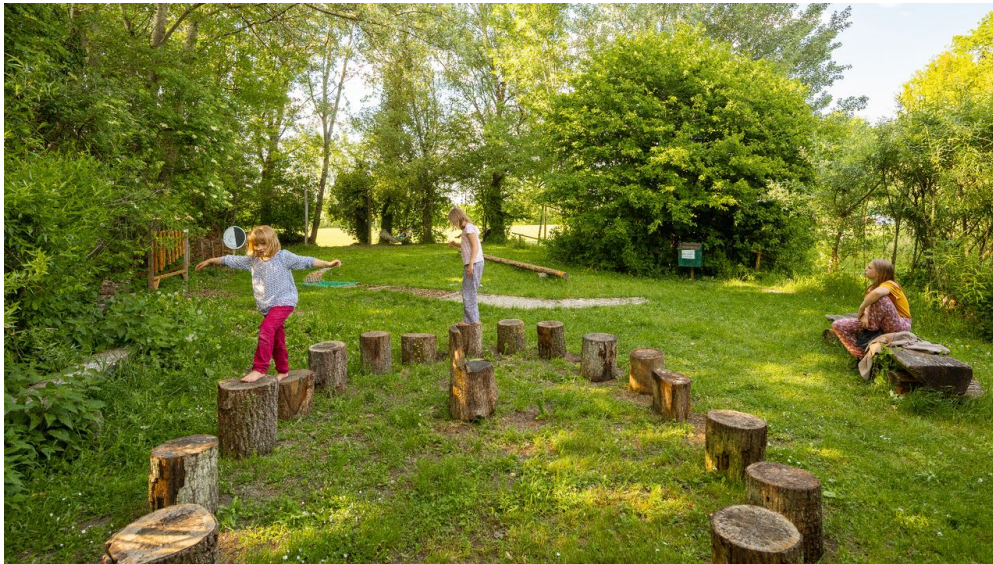
Umweltstation mooseum Außenanlage

Öffnungszeiten gelten für Dauerausstellung. Außengelände und Veranstaltung ganzjährig.