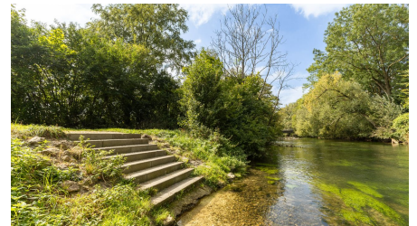
Umweltstation mooseum Brenzuffer