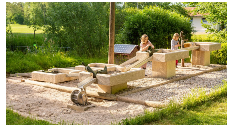
Umweltstation mooseum Wasserspielplatz