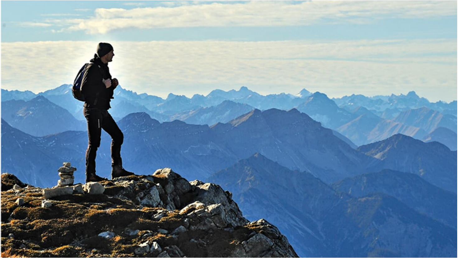
Ammergauer Alpen - Wandern