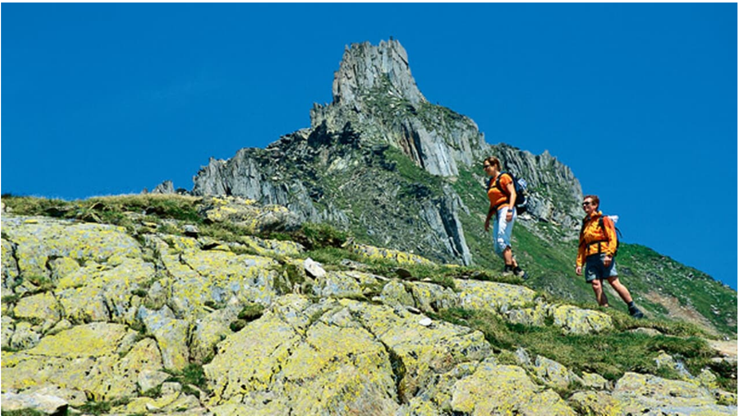
Tessin Chilchhorn