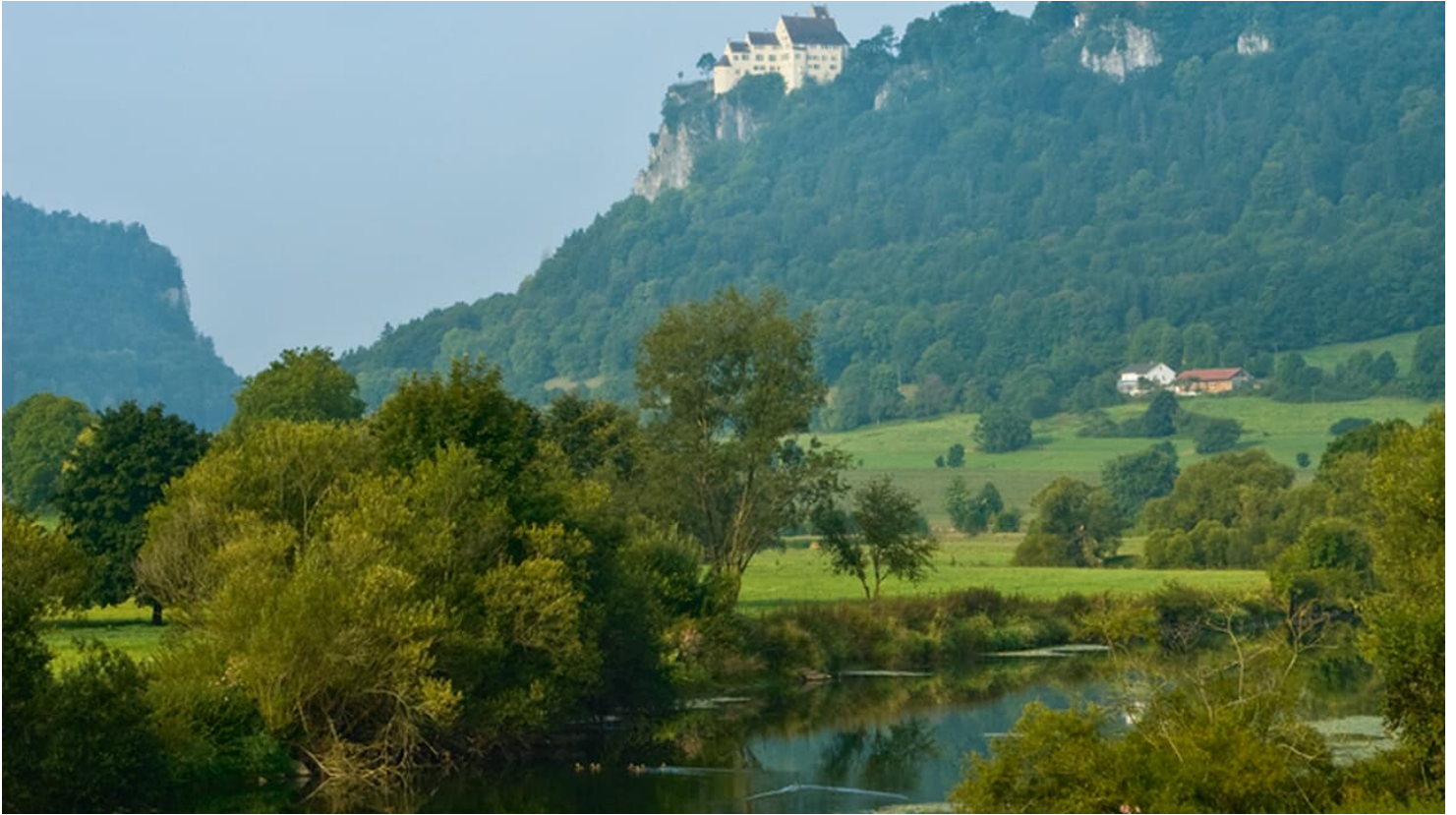
Schloss Werenwag