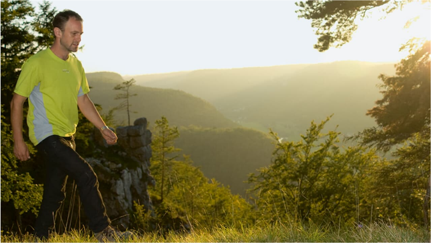
Auf dem Schaufelsen