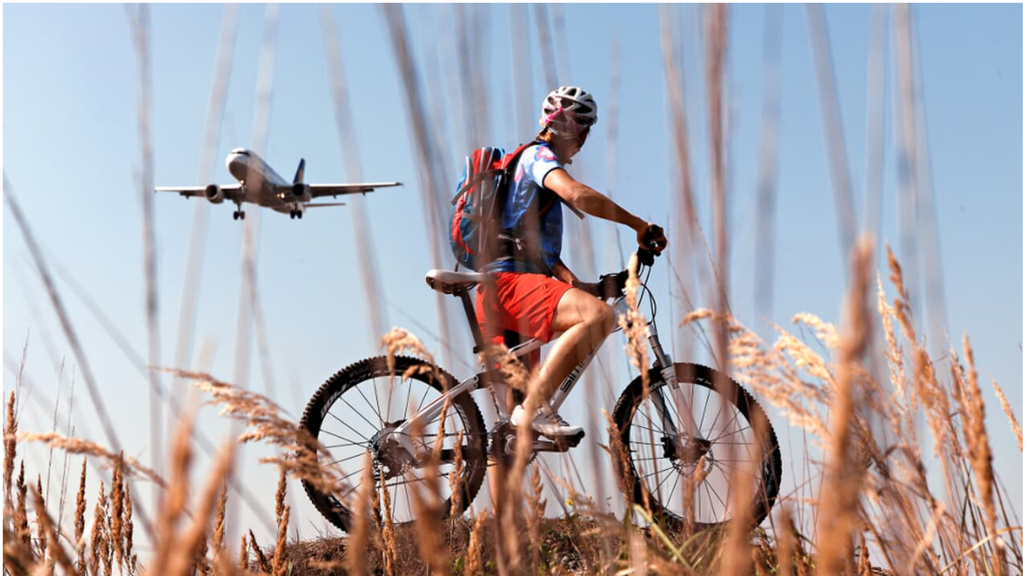
MountainBIKE Frankfurt - Flughafenrunde (Tour 1)