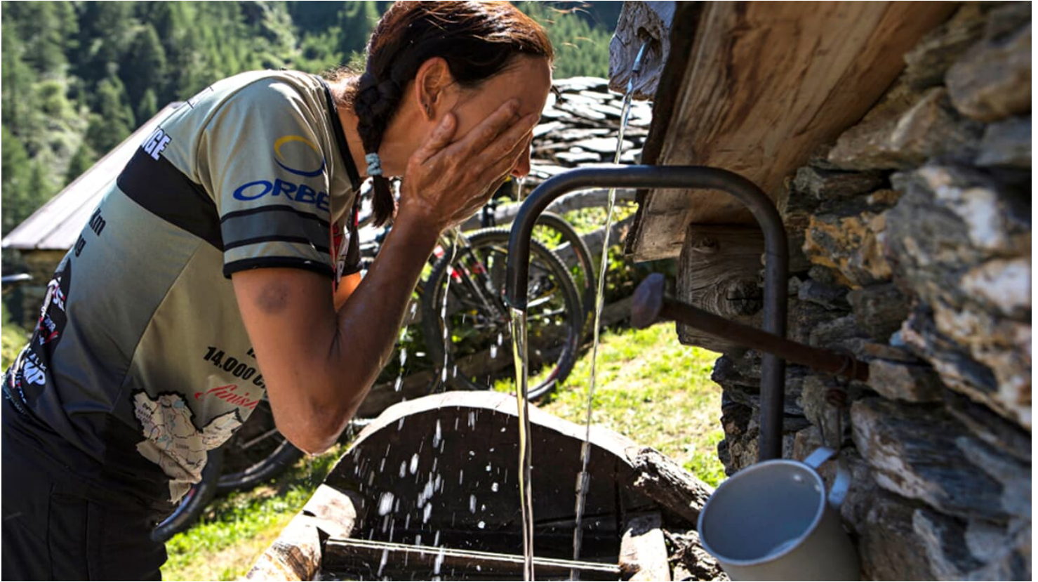
MountainBIKE Piemont Valle Pellice