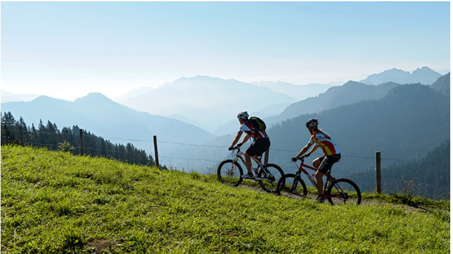
MTB-Touren am Tegernsee