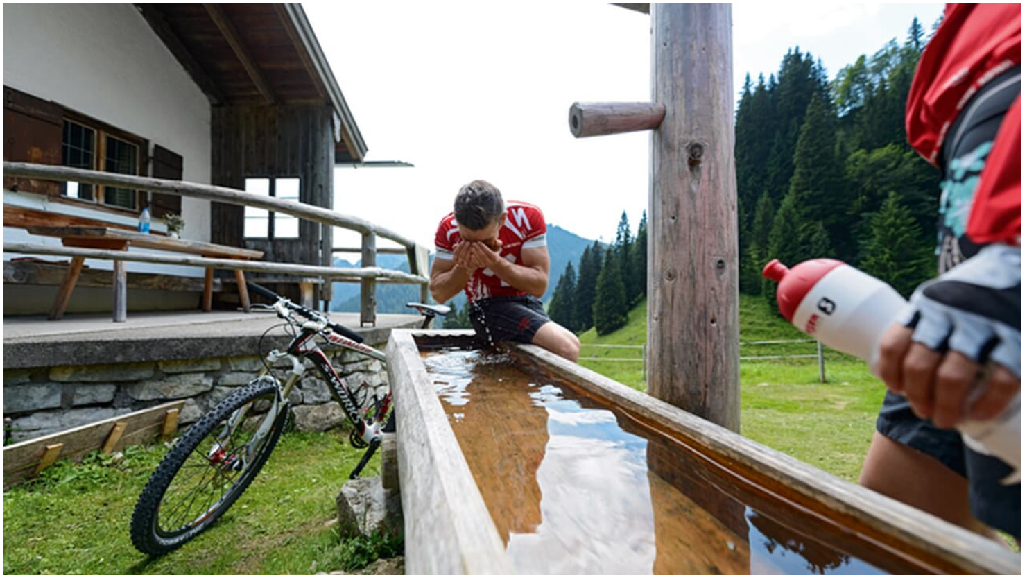
MTB-Touren am Tegernsee