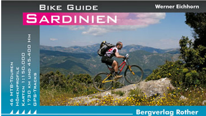
Rother Bike-Guide Sardinien