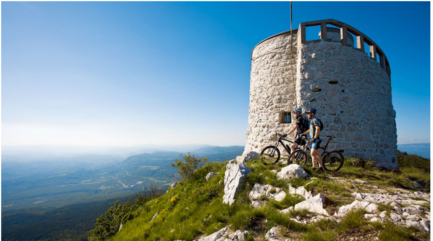
MB-Touren Istrien