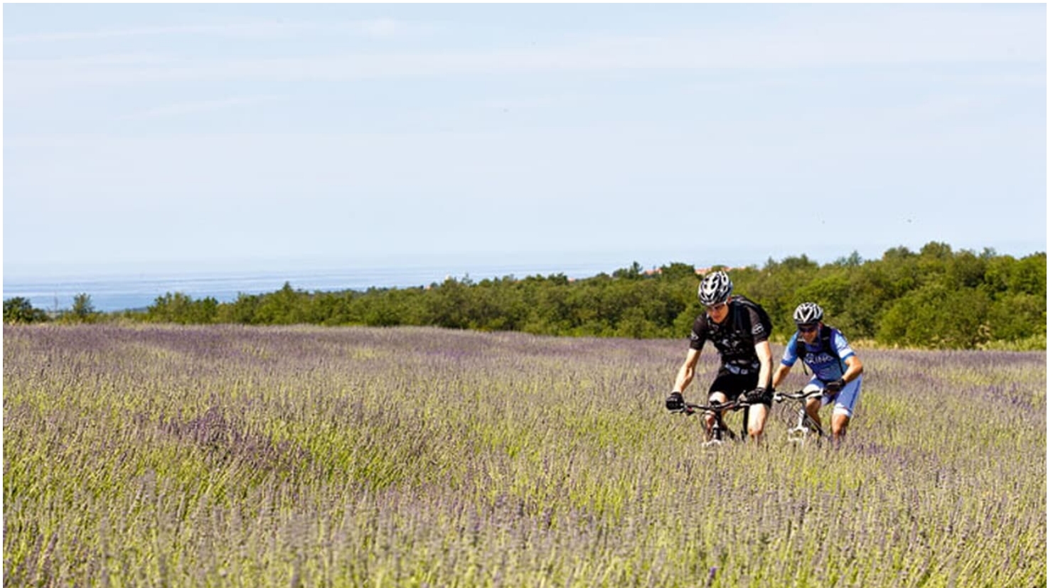
MB-Touren Istrien