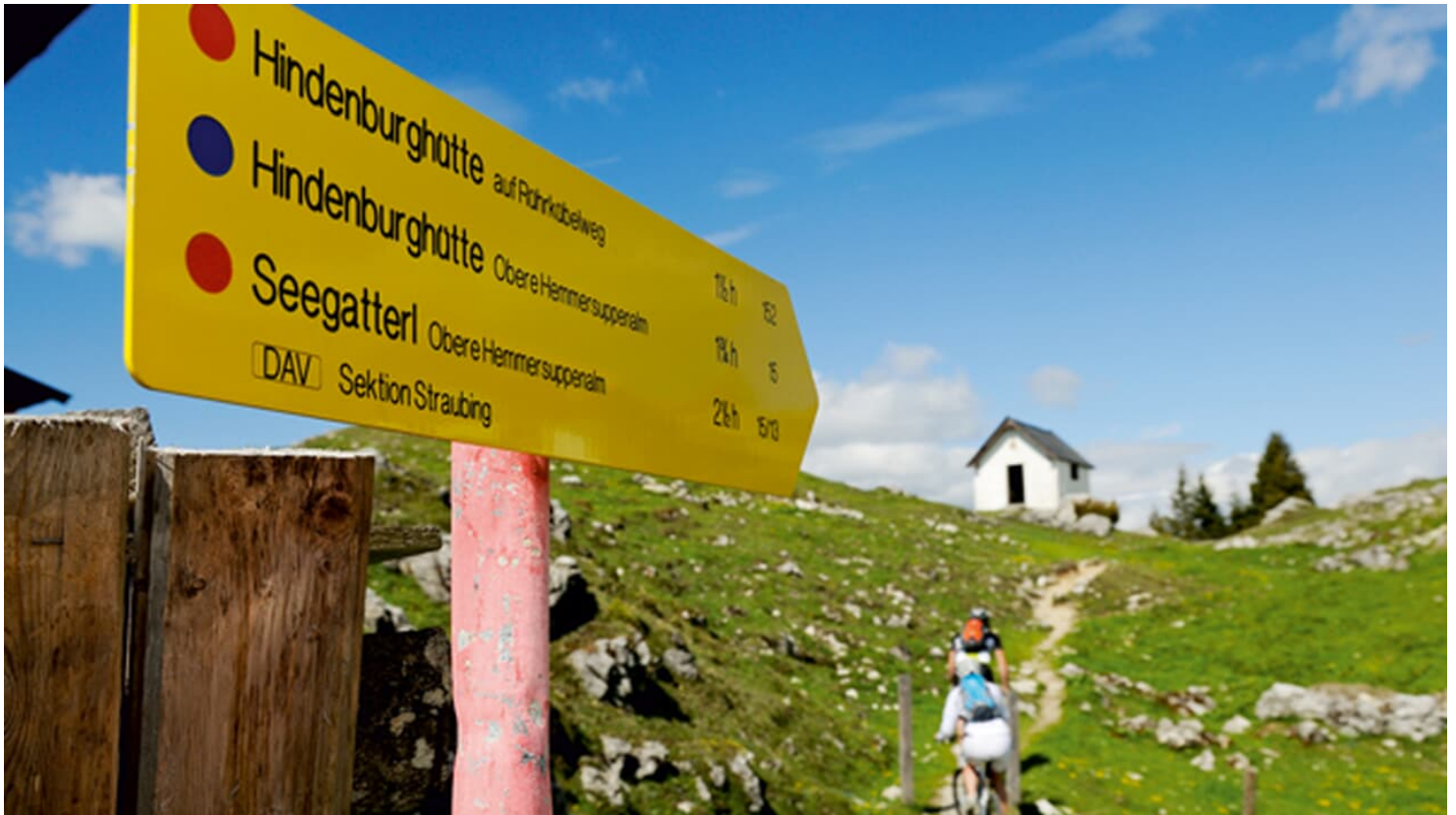
MountainBIKE Reit im Winkl