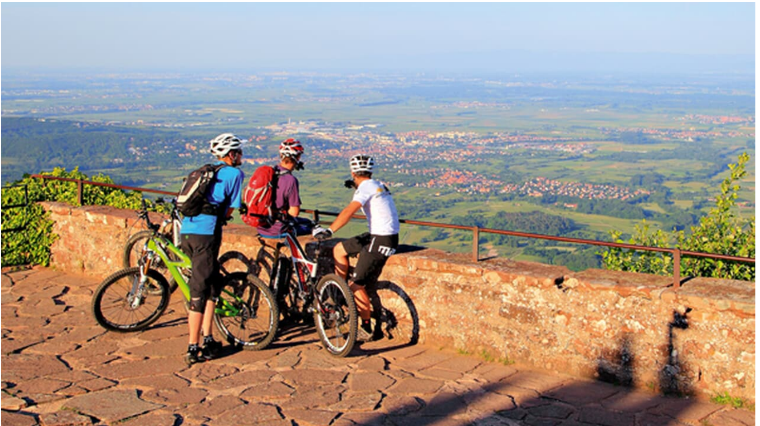
MountainBIKE Vogesen