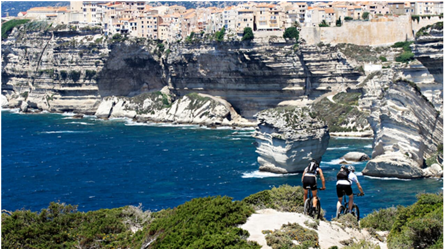
MountainBIKE Korsika