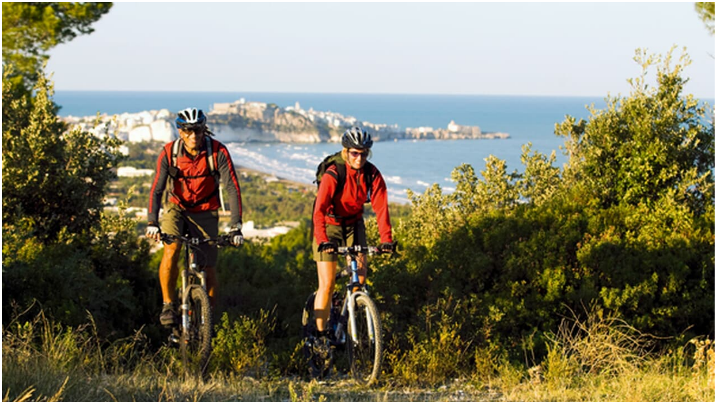
MountainBIKE Gargano