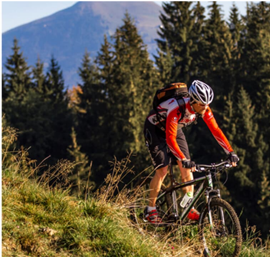
MountainBIKE 0213 Hohe Salve/Brixental