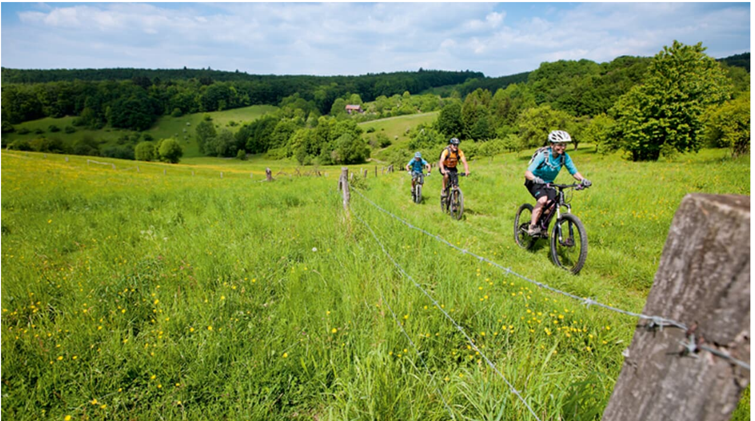
Mountainbike-Tour durch den Odenwald