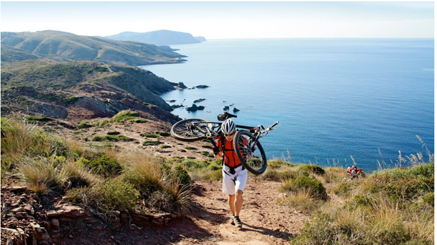
Mountainbike-Touren auf Menorca