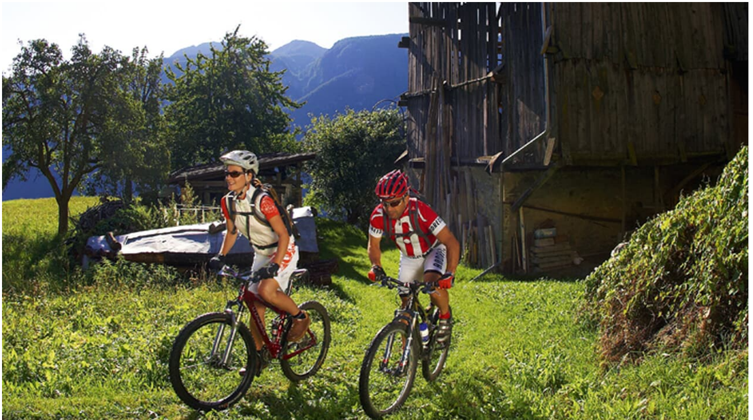
Val di Sole - © Manfred Stromberg