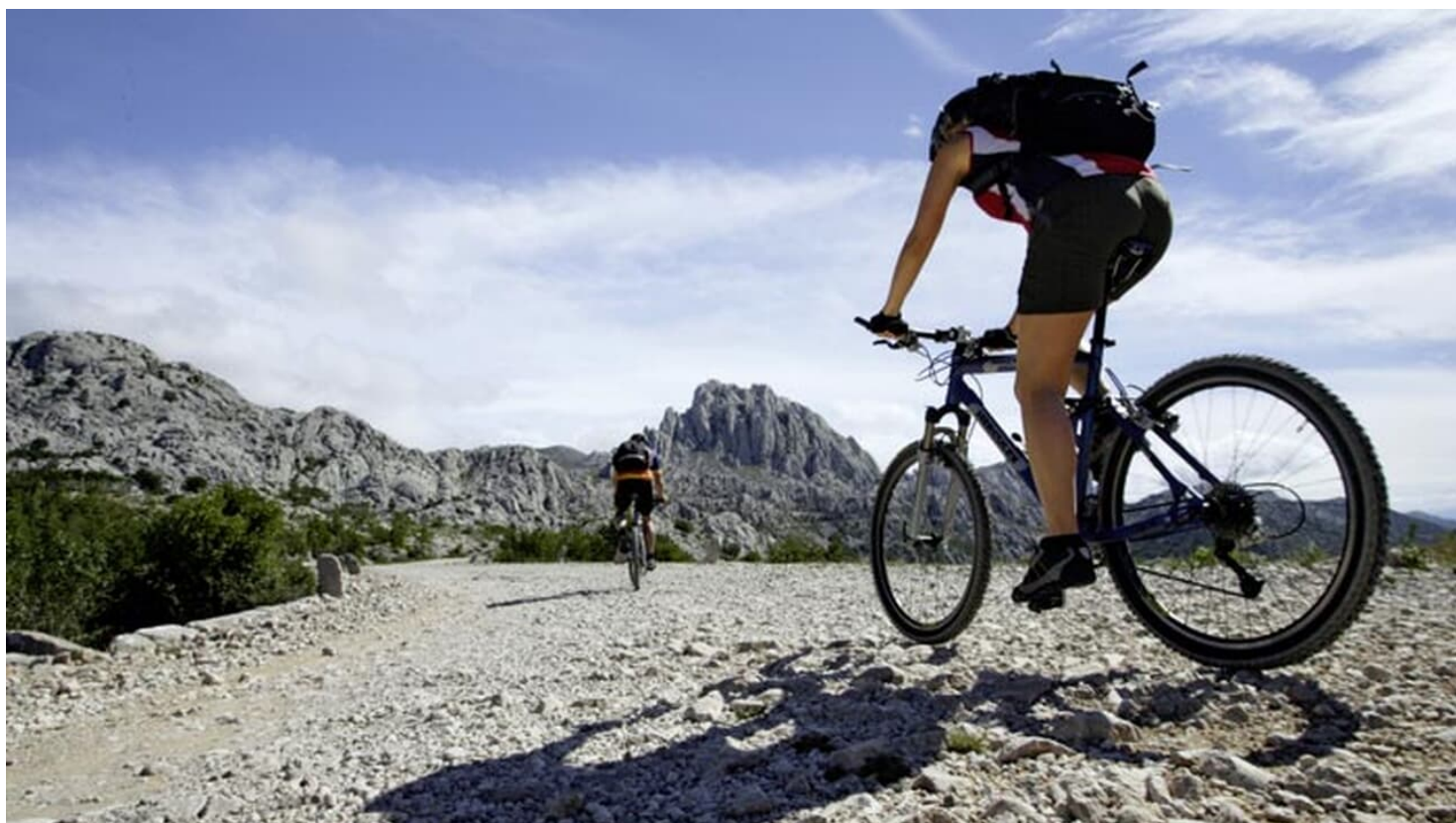
Kroatien - Paklenica