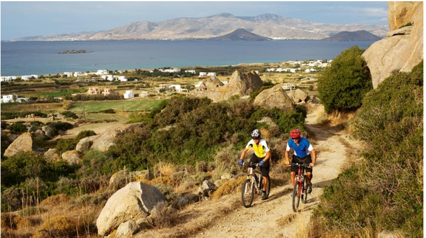
MTB-Spot Naxos