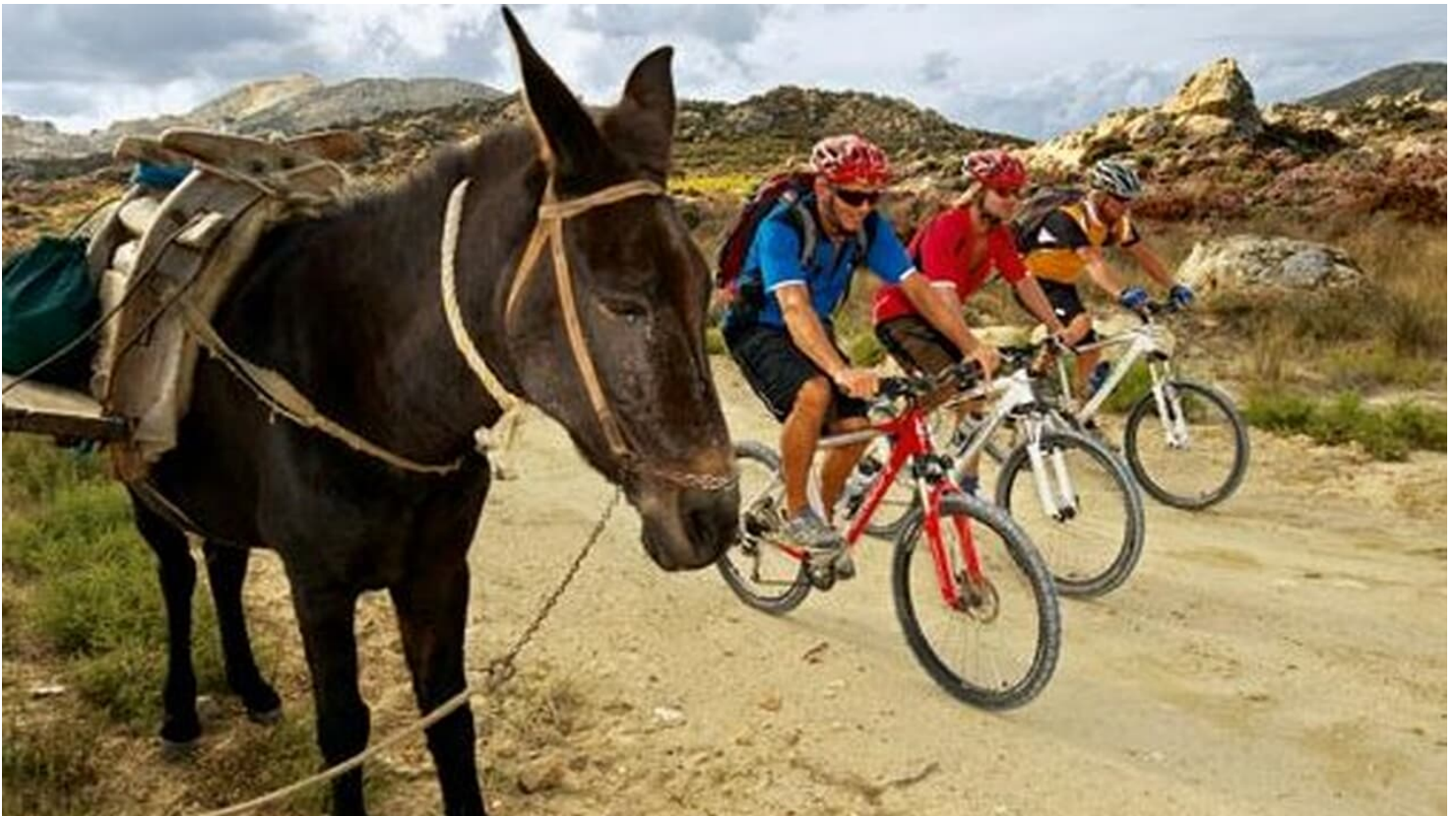
MTB-Spot Naxos