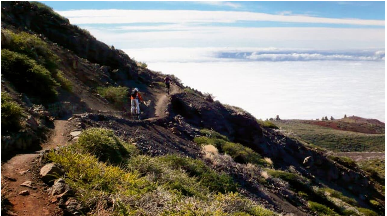
La Palma