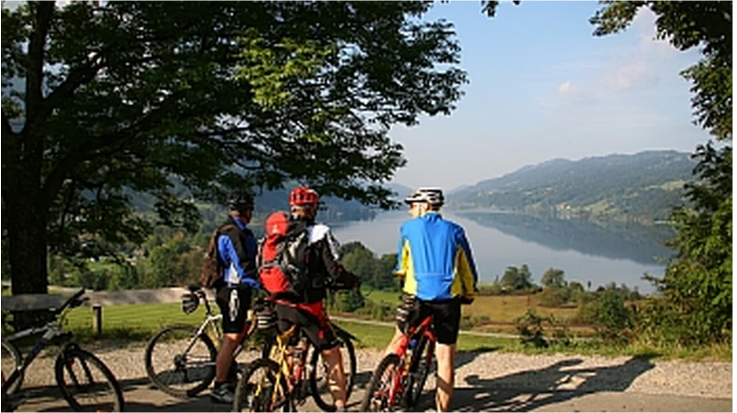
Allgäu-Cross - © www.immenstadt.de