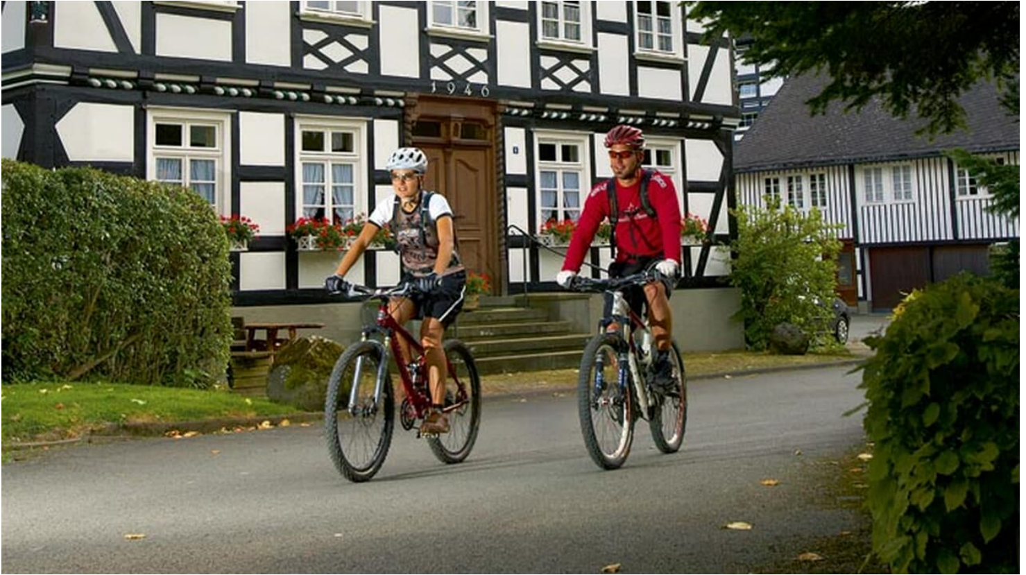
Sauerland - Dorf - © Manfred Stromberg