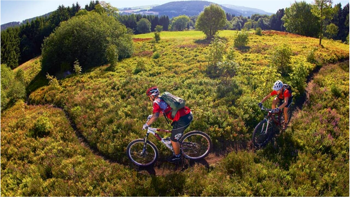
Sauerland - Heidetrail auf dem Orenberg bei Willingen