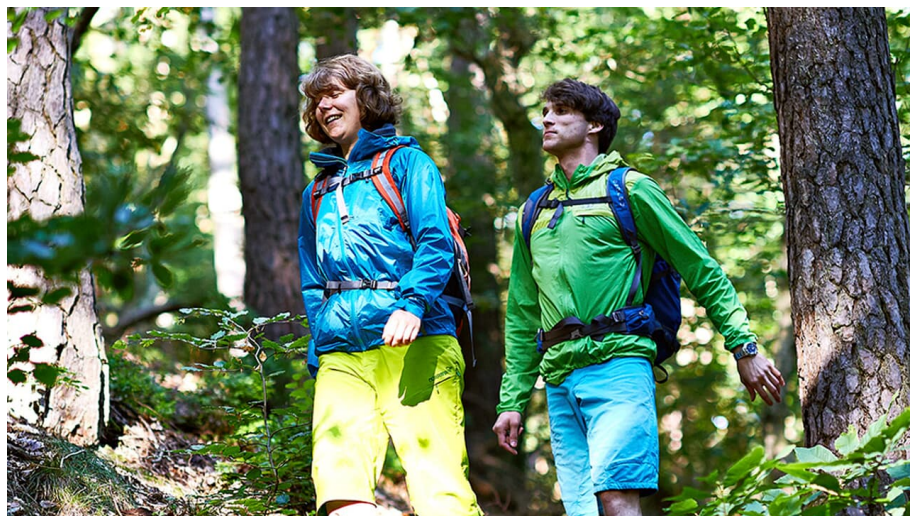
Ramberger Drei-Burgen-Tour