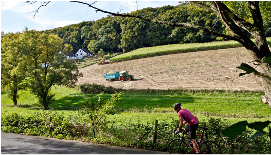
Durch die Felder des Reviers