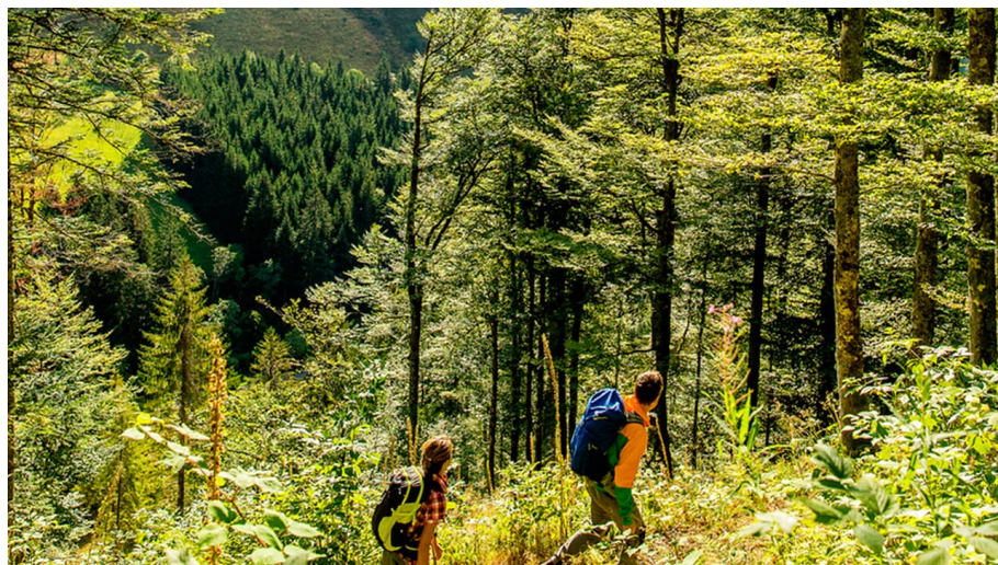
Gipfeltour Menzelschwand