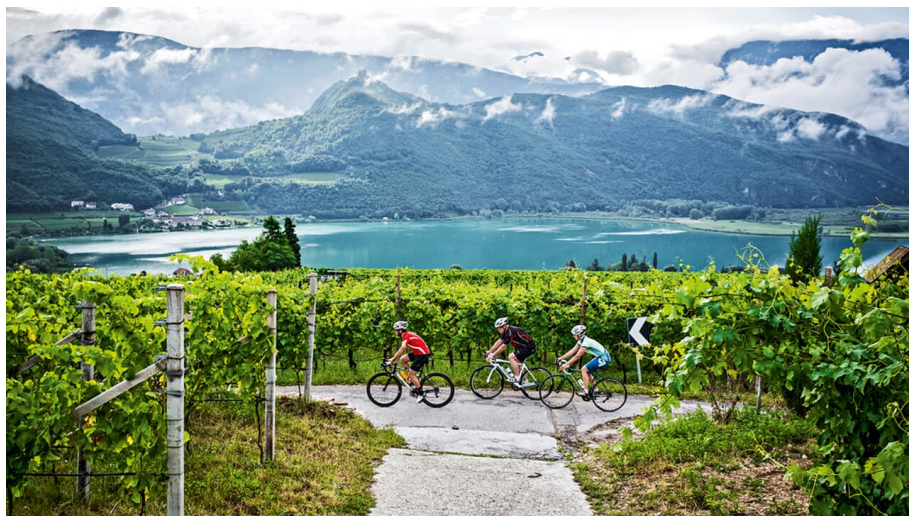
Südtirol Etappe 3