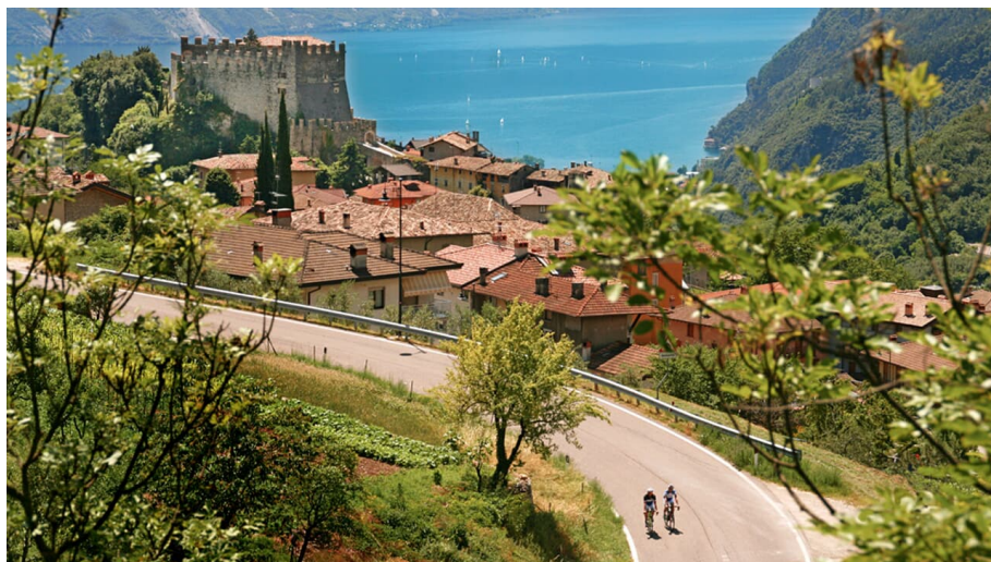
Giro-Klassiker Monte Bondone