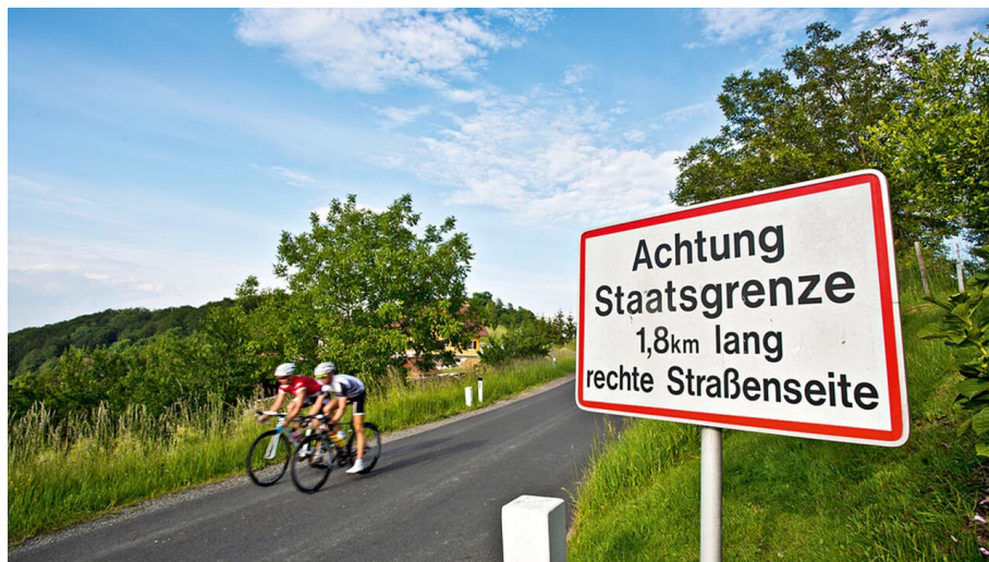
Grenzrunde im Norden