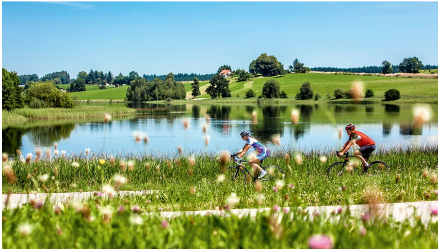
Die Seen-Runde