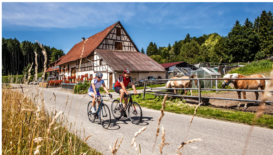
Die Bergetappe