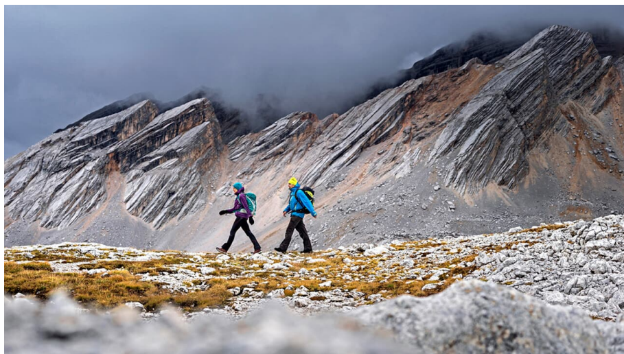
Hüttentrekking in den Dolomiten: Etappe 4