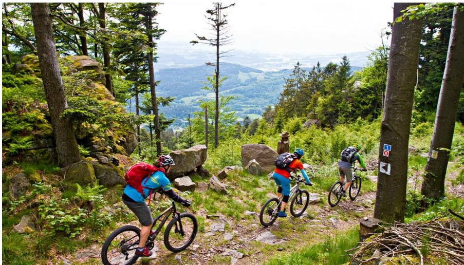
MB-0916-Bayerwald-005 - © Ralf Schanze