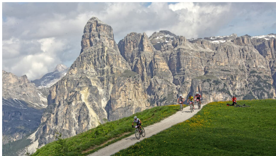
Sellaronda ohne Aufstiegshilfen